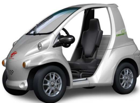
P・COM（シルバーメタリック：新色）