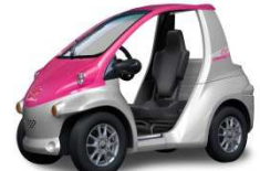
チェリーパールクリスタルシャイン/シルバーメタリック