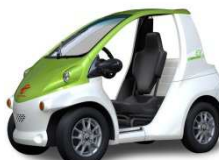
ライムグリーン /ホワイトパールクリスタルシャイン