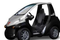
シルバーメタリック /ブラック