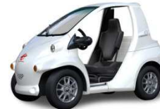
ホワイトパールクリスタルシャイン