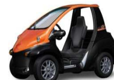
シトラスオレンジマイカメタリック /ブラック