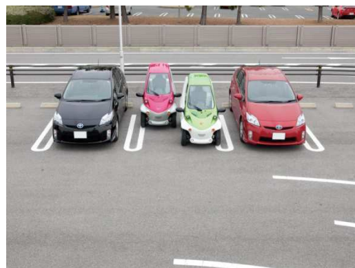
省スペース駐車が可能